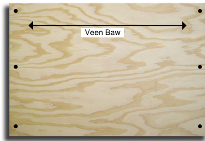
Plywood pi fò nan direksyon venn bwa-a.

Paske panno plywood pa diré lontan, pwa panno-a, ak tan ke sap pran pou enstalé, nou rekòmandé ke nou pa itilize yo a mwen ke nou pa genyen l'òt bagay. Pase pran dokiman nou-an ki rele "Enstalé Panno Siklòn Pou Fènèt" pou nou kapab étidyé l'òt altènatif.