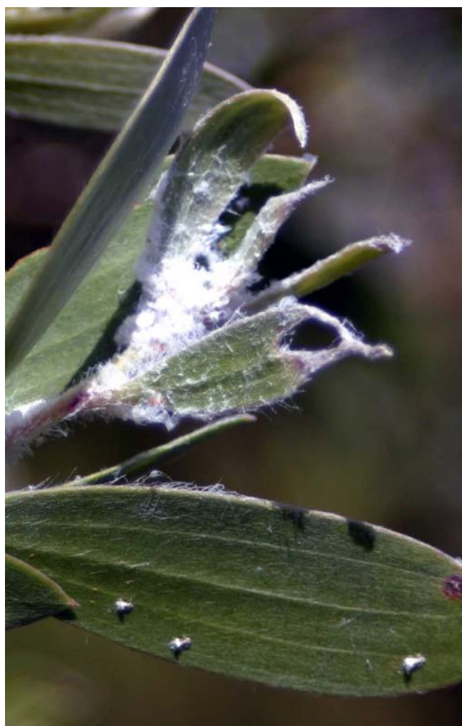
Figura 7. El psílido de melaleuca ( Boreioglycaspis melaleucae ) excreta una sustancia blanca (floculencia) que indica su presencia en melaleuca.

Los herbicidas se usan para exterminar árboles individuales o poblaciones de melaleuca. Para controlar las densas poblaciones de árboles maduros de melaleuca, las agencias estatales y federales aplican herbicidas con ingredientes activos de glyphosate y imazapyr por helicóptero. Estos herbicidas, los cuales pueden ser absorbidos a través de las hojas, también se pueden aplicar con equipo operado a mano para controlar los semilleros y árboles jóvenes. El glyphosate e imazapyr pueden exterminar plantas nativas y no nativas cuando las