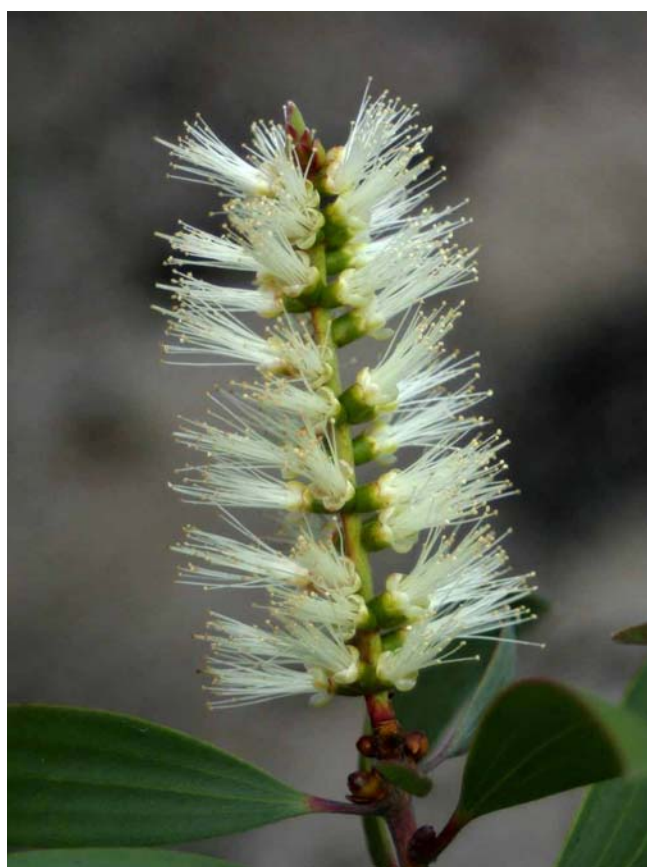
Figura 4. Flor de melaleuca.

turneri ) fue liberada en 2005 y está siendo evaluada por los investigadores del USDA. Aunque no se espera que estos insectos puedan matar a los árboles maduros, se espera que reduzcan el vigor de los árboles, la producción de semillas y el establecimiento de semilleros. Los controles biológicos se propagan de árbol a árbol por sí mismos y el gorgojo de melaleuca y el psílido de melaleuca están presentes en la mayor parte de las áreas del estado donde hay árboles de melaleuca. Las condiciones tales como fríos extremos y aguas estancadas pueden reducir su población; pero las poblaciones de insectos eventualmente repercutirán