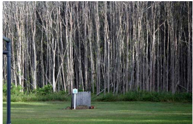
Figura 1. Infestación de melaleuca en Markham Park, Ft. Lauderdale, FL.

Melaleuca forma densas plantaciones, llamadas monocultivos que completamente transforman el carácter de los hábitats naturales. Desplaza las