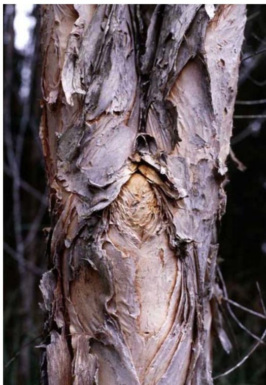
Figura 2. Corteza de melaleuca.