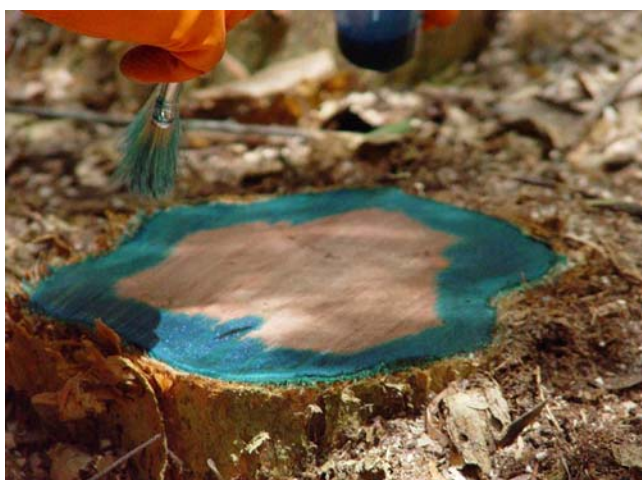
Figura 11. Cuando se aplica el herbicida a un tronco cortado, sólo se necesita aplicar al tejido vivo (cambium) (visto aquí después de haberle agregado la solución del tinte).