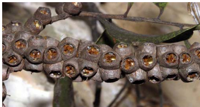
Figura 5. Semillas de melaleuca en cápsulas.

en las áreas infestadas de melaleuca cuando regresen las condiciones favorables.