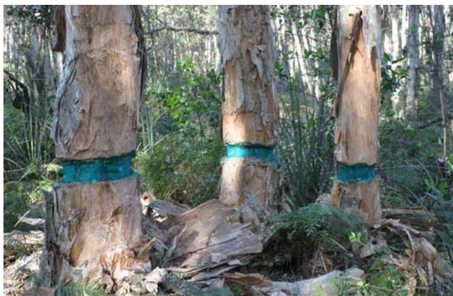
Figura 9. Herbicidas aplicados a melaleuca usando la técnica del corte anular. Las áreas de aplicación se han teñido de azul.

Cuando no se desea dejar árboles parados, se pueden botar, pero usualmente vuelven a nacer de la cepa. Para prevenirlo se aplica herbicida al corte recién hecho (Figura 11). Este método lleva tiempo y trabajo intenso, pero tiene la ventaja de que no quedan árboles parados. Las agencias de administración de tierras usualmente aplican un producto herbicida que contenga imazapyr para el tratamiento de las cepas de melaleuca. Imazapyr está listo para ser absorbido por las raíces de las plantas y puede matar plantas deseadas si entra en contacto con sus raíces. Por lo tanto, no se recomienda su uso en los jardines.