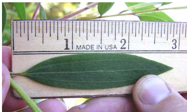
Figura 3. Hoja de melaleuca.

turneri ) fue liberada en 2005 y está siendo evaluada por los investigadores del USDA. Aunque no se espera que estos insectos puedan matar a los árboles maduros, se espera que reduzcan el vigor de los árboles, la producción de semillas y el establecimiento de semilleros. Los controles biológicos se propagan de árbol a árbol por sí mismos y el gorgojo de melaleuca y el psílido de melaleuca están presentes en la mayor parte de las áreas del estado donde hay árboles de melaleuca. Las condiciones tales como fríos extremos y aguas estancadas pueden reducir su población; pero las poblaciones de insectos eventualmente repercutirán