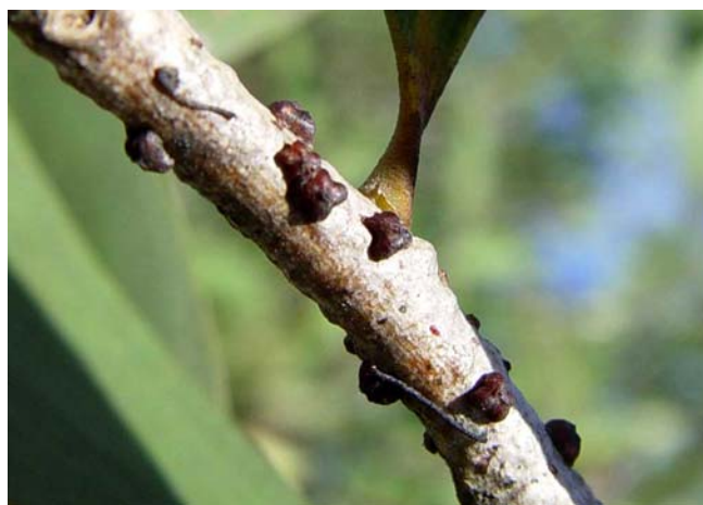
Figura 8. El insecto lobate lac scale ( Paratachardina lobata lobata ) en melaleuca.

hojas entran en contacto con estos herbicidas y el imazapyr también puede exterminar plantas cuando las raíces entran en contacto con él. Por lo tanto,