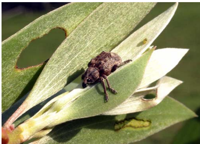
Figura 6. El gorgojo de melaleuca ( Oxyops vitiosa ).

número de diminutos pedazos de cortezas e insectos en las ramas. Este insecto no sólo es destructivo para melaleuca pero también para muchas plantas ornamentales y vegetación nativa. Información de cómo controlar el insecto lac scale en los jardines, puede obtenerse en la Oficina de Servicio de Extensión Cooperativa del Condado.