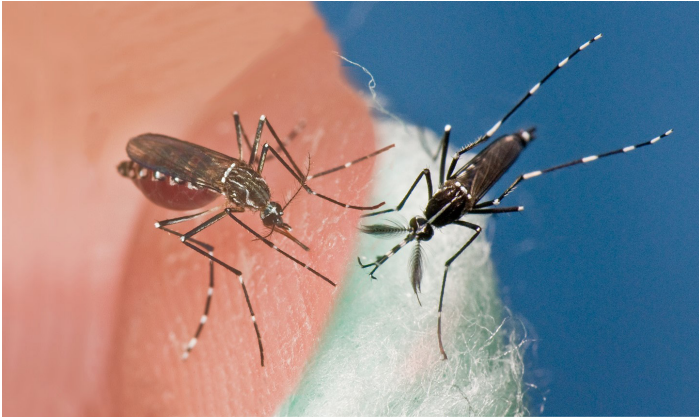
Figura 1. Los mosquitos invasores Aedes aegypti (izquierda) y Aedes albopictus (derecha) ocurren en las Américas, incluyendo Florida, y han sido implicados en la transmisión del virus Zika.

J. R. Rey, L. P. Lounibos, B. W. Alto, N. D. Burkett-Cadena, C. C. Lord, C. T. Smartt, y C. R. Connelly.