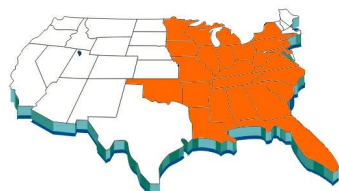
Casos de Encefalitis de La Crosse Reportados entre 1964 y 1997

La encefalitis de La Crosse es una enfermedad no común causada por un virus y esparcida por mosquitos infectados. La enfermedad afecta al sistema nervioso central y puede ser seria y hasta fatal. Su nombre viene de la ciudad de La Crosse, Wisconsin (EU), donde fué identificada por primera vez en 1963. Desde entonces, la encefalitis de La Crosse ha sido identificada en varios estados del Medio Oeste y del Medio Atlántico (Cuadro 1).