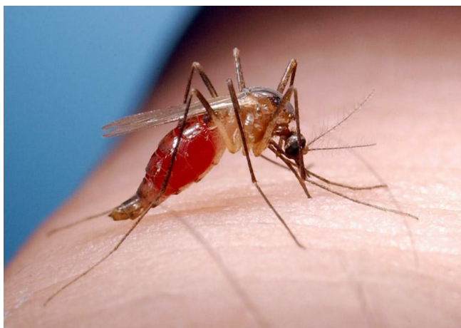
Cuadro 2. El mosquito de huecos, Ochlerotatus triseriatus .

El virus se mantiene durante el invierno por transmisión transovarria en los huevos de mosquitos (hembras infectadas ponen huevos que acarrean el virus y que eclosionan eventualmente a mosquitos infectados). En el ciclo normal, el virus es transmitido al hospedero vertebrado a través de la picada de un mosquito infectado. En el hospedero, el virus se multiplica rápidamente (proceso llamado “amplificación”). Cuando llega a cierta abundancia, el virus entonces puede ser pasado a otros mosquitos que piquen al hospedero infectado. Las ardillas infectadas no demuestran señas ni síntomas de la enfermedad.