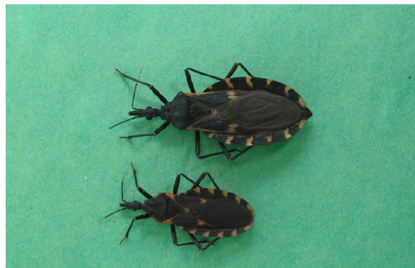
Cuadro 1. Arriba: Triatoma gerstaeckeri hembra. Abajo: Triatoma sanguisuga macho.