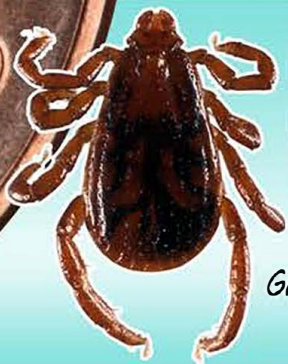
GARRAPATA MARRÓN DEL PERRO