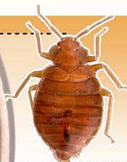
CHINCHE DE CAMA

¡Puedes medir el insecto con un CENTAVO!