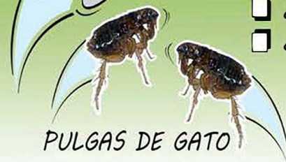
PULGAS DE GATO