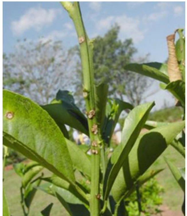
Figura 6a. Lesiones jóvenes de cancro cítrico en ramas jóvenes.