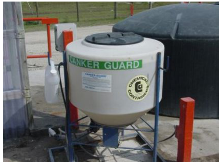
Figura 11c. Tanque grande usado para el almacenaje del agente descontaminante para las estaciones automáticas.