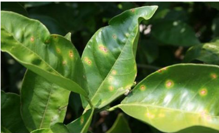
Figura 4. Lesiones jóvenes de cancro cítrico con un halo amarillo.

marrón y el margen acuoso luce rodeado por un anillo o halo amarillo. El centro de la lesión se levanta y es de consistencia similar al corcho. Normalmente, las lesiones son visibles en ambos lados de la hoja (Fig. 5).