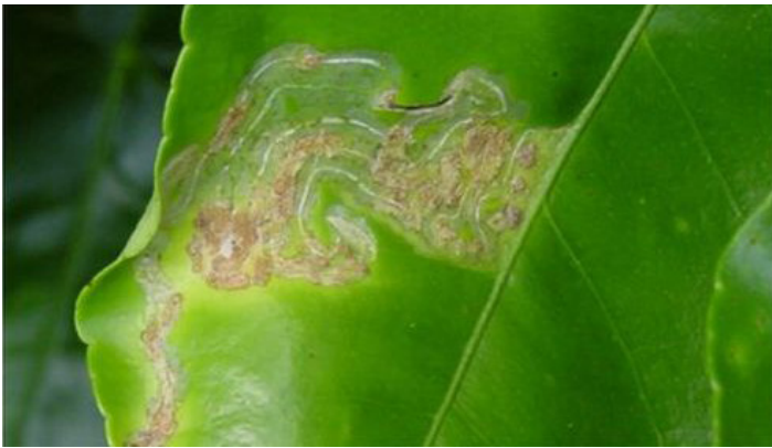
Figura 2. Lesiones de cancro en las galerías del minador de la hoja en su parte superior.