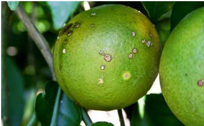
Figura 7. Lesiones de cancro jóvenes similares a una ampolla en frutas.

Lesiones en la fruta. Las lesiones jóvenes son elevadas similares a una ampolla, bronceadas y pueden estar rodeadas de un halo amarillo en función de la madurez del fruto (Fig. 7). Con el envejecimiento de las lesiones, éstas se vuelven