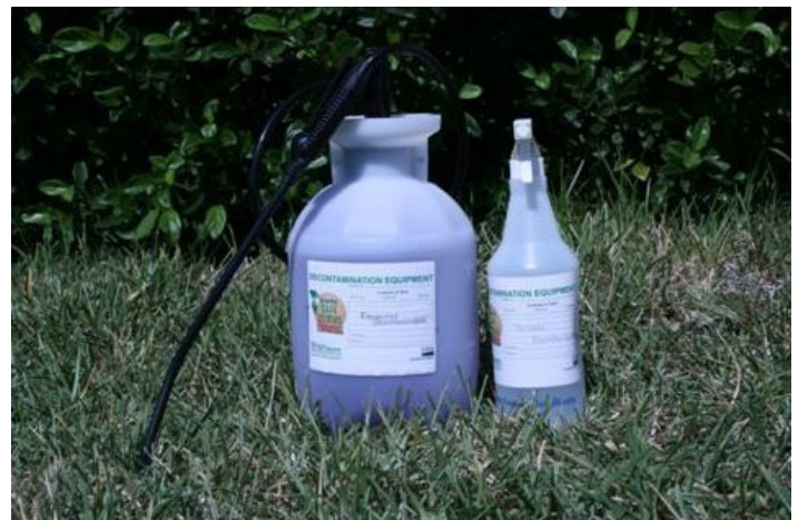
Figura 12. Tipos de botellas de spray.