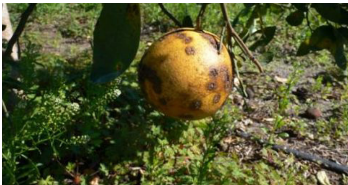
Figura 8. Lesiones de cancro cítrico viejas en los toronja.