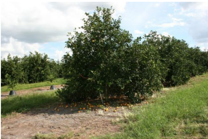
Figura 9. Caída de la fruta causada por un brote severo de cancro.

de color marrón oscuro a negro, hundidas y acorchadas y pueden tener un halo amarillo (Fig. 8). Las lesiones viejas suelen tener una apariencia gris. Generalmente las lesiones son circulares y varían en tamaño. Las lesiones causan manchas y la caída prematura del fruto, reduciendo así el rendimiento de la producción de fruta (Fig. 9). La calidad interna de la fruta no se ve afectada.