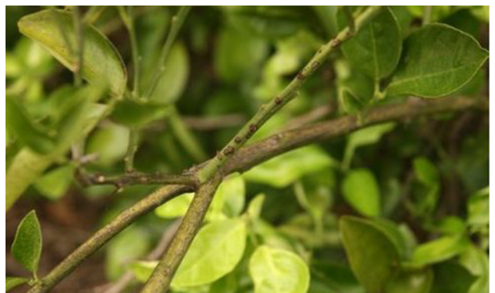
Figura 6b. Lesiones viejas de cancro cítrico en ramas.