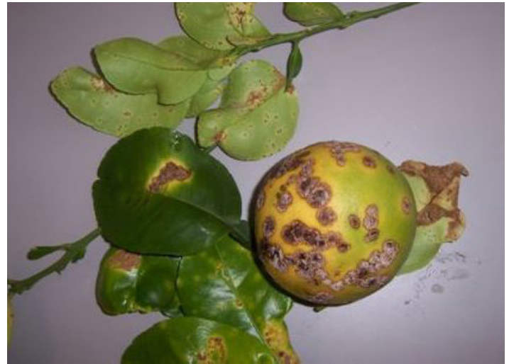
Figura 1. Lesiones necróticas del cancro en los tallos, hojas y frutos de toronja.

El minador de la hoja de cítricos ( Phyllocnistis citrella ) incrementa la vulnerabilidad y susceptibilidad de los cítricos al cancro. Las hojas y tallos dañados por el minador de los cítricos son más propensos a ser infectados porque las heridas permiten una fácil penetración de la bacteria en el tejido (Fig. 2). Cuando las galerías de alimentación del minador se contaminan con la bacteria, el número de lesiones y el área infectada aumenta en gran medida y también los resultados en la producción de inóculo.