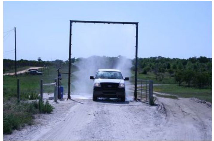
Figura 11b. Estación automática de descontaminación de vehículos y equipamiento.

de dos-en-uno, las soluciones de descontaminación se destinan a uso personal o de equipo. No utilizar la solución designada para el equipo en nuestra piel, ya que es más fuerte que la solución personal. Las soluciones de