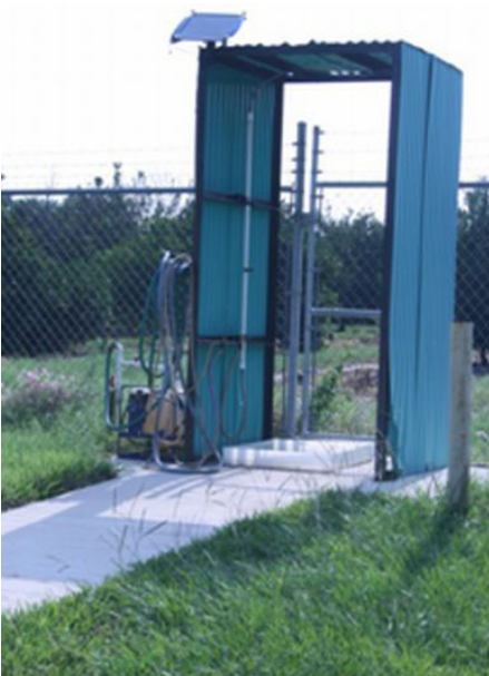
Figura 11a. Estación automática de descontaminación personal.

de dos-en-uno, las soluciones de descontaminación se destinan a uso personal o de equipo. No utilizar la solución designada para el equipo en nuestra piel, ya que es más fuerte que la solución personal. Las soluciones de