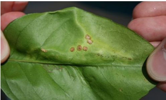
Figura 3. Lesiones jóvenes de cancro cítrico similares a una ampolla.