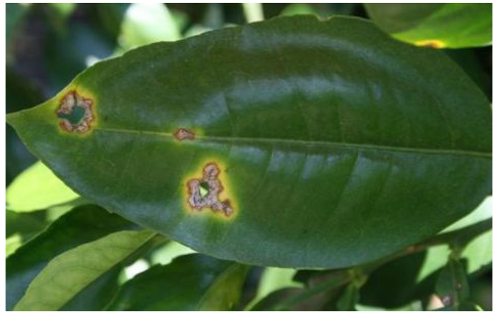
Figura 5. Lesiones viejas de cancro cítrico mostrando el efecto de barrenillo.

Lesiones en tallo y ramas. Normalmente, las lesiones del tallo indican que se ha presentado una infección durante, al menos, un año. Éstas sirven como depósito de inóculo persistente y son capaces de producir inóculo por hasta cuatro años. Cuando se producen en los tejidos leñosos éstos