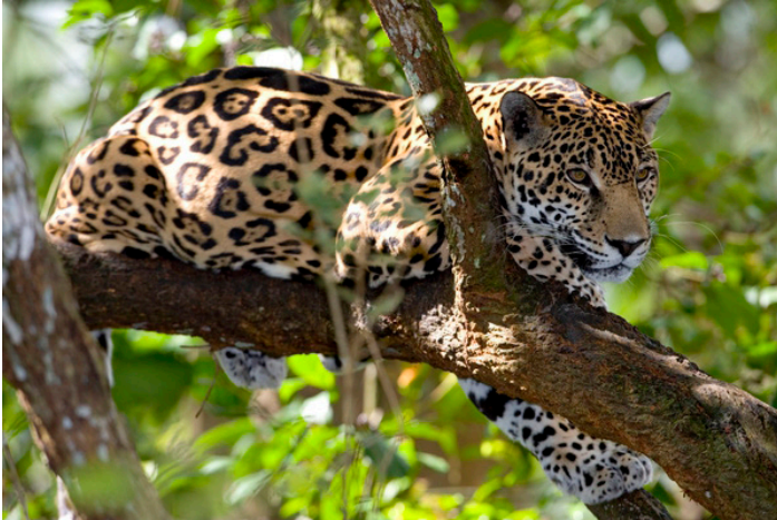
Figure 2. Jaguar ( Panthera onca )

poseen grandes ámbitos de hogar y cazan diferentes animales, particularmente aquellos de mayor tamaño como venados y pecaríes. Ellos normalmente cazan de noche, pero en algunas ocasiones se les ve activos durante el día. El jaguar posee un cuerpo compacto con una cabeza ancha. Su pelaje es comúnmente de color amarillo-dorado con machas negras en forma de rosa. Existen jaguares de color negro, sin embargo éstos son muy raros en Belice.