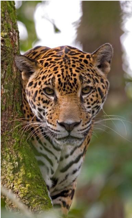
Figure 1. Jaguar ( Panthera onca)