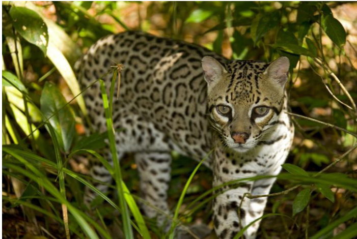
Figure 6. Ocelote ( Leopardus pardalis )

En promedio: 2.5 pies de largo y 22 lbs.