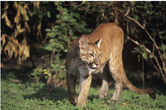
Figure 7. Puma ( Puma concolor )

En promedio: 3.25 pies de largo y 100 lbs.