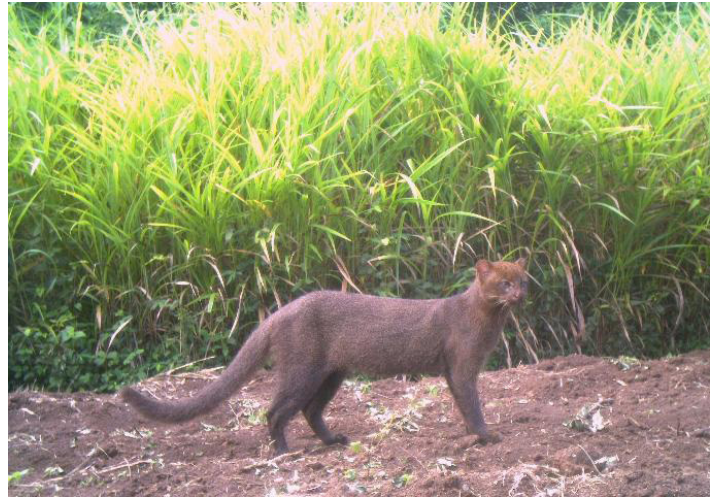
Figure 3. Jaguarundi ( Puma yagouaroundii )

En promedio: 2.3 pies de largo y 15 lbs.