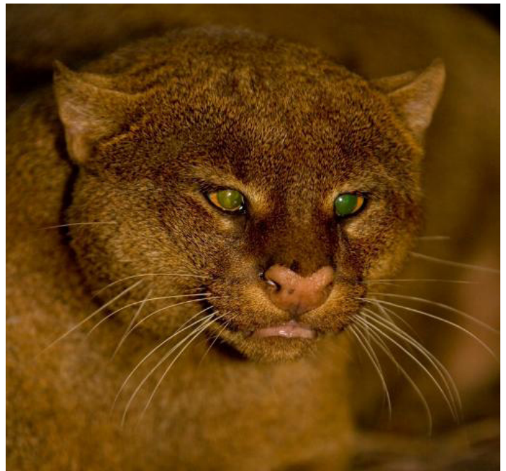
Figure 4. Jaguarundi ( Puma yagouaroundii )

El jaguarundi (halari, leoncillo, gato nutria) es pequeño, poco conocido y muy comúnmente confundido con tayras o perros de monte. Ellos son más activos durante el día y cazan aves, lagartijas y mamíferos pequeños. Sus cuerpos son alargados y delgados y su pelaje puede ser negro-grisáceo o rojo.