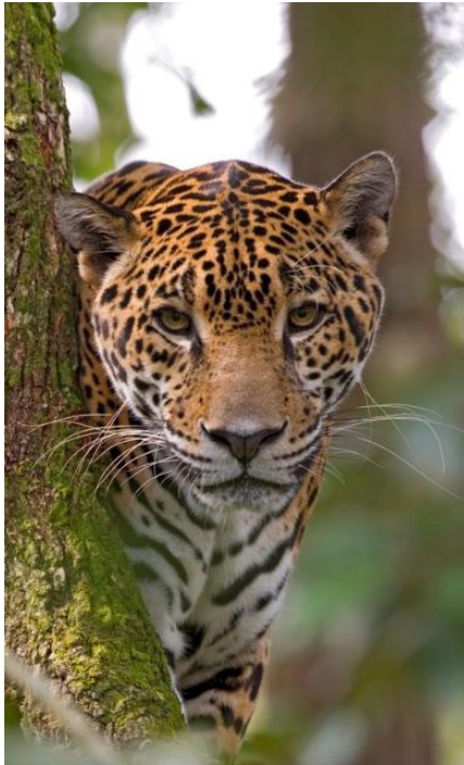
Figure 1. Jaguar ( Panthera onca)