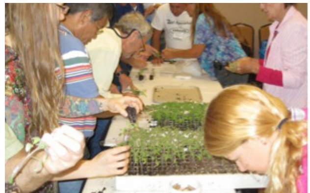
Figura 1. Taller de producción de injertos de tomates.