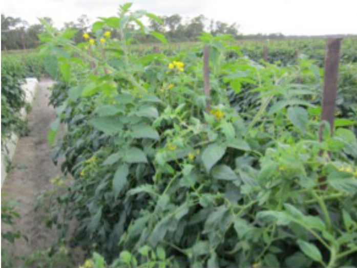
Figura 4. Rebrote del patrón y excesivo vigor de la variedad 'Tygress' resistente a Tomato Yellow Leaf Curl Virus el resultado de la interacción de la expresión del patrón y del material genético injertado.

mecanismos bioquímicos y fisiológicos. No fue hasta hace poco que la investigación realizada ha comenzado a dilucidar aspectos sobre el transporte de larga distancia de ARN a través de floema en plantas injertadas (Kudo y Harada, 2007). Dilucidar el papel del ARN transmisor del injerto en la modificación de los caracteres del injerto y lograr el vigor deseable del injerto representa enormes oportunidades para el uso innovador de los recursos genéticos en la producción de tomate.