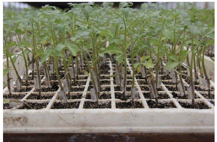
Figura 2. La variedad injertada Tygress' resistente a Tomato Yellow Leaf Curl Virus con diferentes patrones.