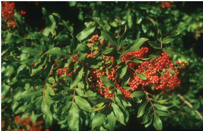
Figura 1. Brazilian pepper-tree es una de las plantas invasoras más agresivas en Florida.

Los ecosistemas naturales de Florida están siendo degradados por la invasión de plantas exóticas. Esta invasión es en parte responsable por la reducción del número y la calidad de comunidades nativas presentes en Florida.