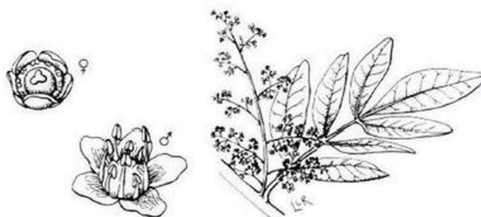
Figura 4. Flores masculinas y femeninas de plantas maduras de Brazilian pepper-tree.

Brazilian pepper-tree es un arbusto o árbol pequeño que puede medir hasta 10 m (33 pies) de altura, y tiene un tronco corto que está escondido entre una densa zona de ramas. Las hojas compuestas tienen una nervadura media rojiza y en ocasiones alada, y tienen de 3 a 13 hojas simples (hojuelos) finamente dentadas y de forma rectangular o elíptica de 2.5 a 5 cm (1 to 2 in) de largo (Figura 3). Las hojas producen un olor a trementina al ser trituradas. Las plantas tienen flores masculinas y femeninas por separado y cada sexo ocurre en grupos y en plantas separadas. Ambas flores femeninas y masculinas son de color blanco y están compuestas por 5 partes; las flores masculinas tienen 10 estambres y 5 en cada fila (Figura 4). Los pétalos miden 1.5 mm (0.6 in) de largo. Las flores masculinas también poseen un disco lobulado entre los estambres. Las frutas ocurren en grupos, y al principio se caracterizan por ser de color verde brillante y jugosas, y al madurar se tornan de color rojo intenso, y miden 6 mm (2.4 in) de ancho. Luego, la cáscara roja se seca y se convierte en una delgada cobertura que envuelve a la semilla. La semilla es marrón oscura y mide 0.3 mm (0.1 in) de diámetro.