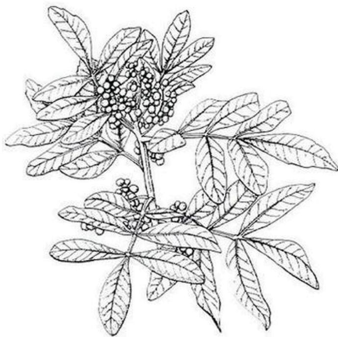
Figura 3. Hojas y frutos de plantas maduras de Brazilian pepper-tree.