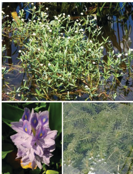
Figura 3. Lagunilla ( Alternanthera philoxeroides ), jacinto de agua ( Eichhornia crassipes ), y hydrilla ( Hydrilla verticillata ). Las tres especies están incluidas en La Lista de Malas Hierbas Nocivas de Florida pero también están incluidas en la Lista Federal de Malas Hierbas Nocivas. El FDACS DPI controla y hace cumplir La Lista de Malas Hierbas Nocivas de Florida.