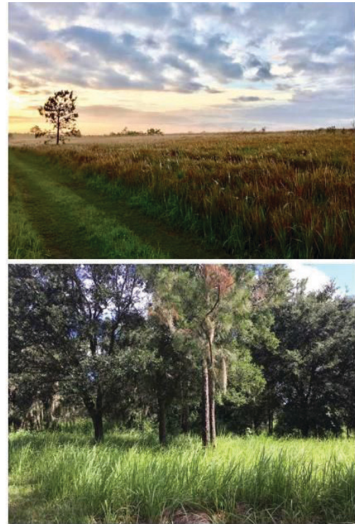
Figura 1. Dos ejemplos de invasión de carrizo ( Imperata cylindrica ) en el centro de la Florida, la primera en un campo al aire libre y la segunda en un área natural forestal. El ñame blanco (conocido con otros nombres anteriormente descritos) se encuentra en la Lista Federal de Malas Hierbas Nocivas. Está prohibido todo transporte interestatal o internacional de esta especie.

La Lista Federal de Malas Hierbas Nocivas está a cargo del USDA APHIS PPQ y la última actualización se produjo en 2010 (en 2017 se efectuaron cambios menores). La lista abarca diversas especies que se encuentran en Florida, incluidas el carrizo ( Imperata cylindrica ), la hydrilla ( Hydrilla verticillata ), el helecho trepador del viejo mundo ( Lygodium microphyllum ), tropical soda apple ( Solanum viarum ), melaleuca ( Melaleuca quinquenervia ) y el helecho acuático ( Salvinia molesta ) (Figura 1). Para más información, puede consultar en línea el Tratado de Plantas Protegidas: https://www.govinfo.gov/content/pkg/PLAW-106publ224/html/PLAW-106publ224.htm .