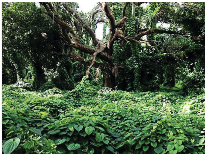
Figura 2. Invasión de ñame blanco (también conocido como yampí, ñame blanco, ñame baboso, papañame y papa de aire) ( Dioscorea bulbifera ) en el sur de la Florida (Condado de Broward). El ñame blanco está en la Lista de Malas Hierbas Nocivas de Florida. El FDACS DPI monitorea y ejecuta esta lista.

siguiente enlace https://www.flrules.org/gateway/readFile.asp?sid=0&tid=0&cno=5B-57&caid=1441825&type=4&file=5B-57.doc .