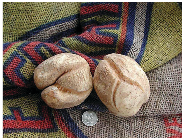
Figure 2. Ejemplos de grietas de crecimiento severas en 'Atlantic' que reducirían su comerciabilidad.