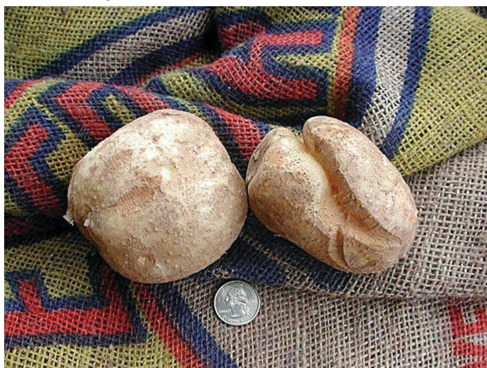
Figure 1. Grietas de crecimiento moderadas (izquierda) y severas (derecha) en 'Atlántic'.

Las grietas de crecimiento severo pueden impactar la calidad de las papas fritas y afectar el procesamiento (Figura 2).