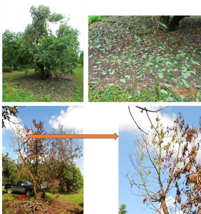
Figura 3. Árboles adultos afectados por la marchitez del laurel con secciones del árbol mostrando una defoliación grande mientras que otras secciones las hojas permanecen en las ramas antes de que ocurra la muerte regresiva y finalmente la muerte del árbol

Al contrario, las inyecciones profilácticas con Tilt® son mucho menos costosas y se ha demostrado que previenen los brotes de ML en las arboledas comerciales de aguacate. El movimiento sistémico del fungicida a través del árbol toma de siete a ocho meses, y la protección que brinda a la ML ha sido reportada en un rango de 12-14 meses, dependiendo de la tasa de fungicida, el tamaño del árbol, estado de la arboleda en el momento de infección con la ML, y la historia de la arboleda con respecto a esta enfermedad (Brooks Tropical, comunicación personal).