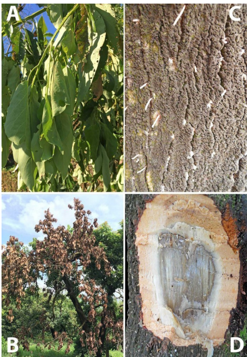
Figura 2. Los síntomas externos visibles de la marchitez del laurel comienzan por la marchitez de hojas verdes (A), típicamente en una sección de un árbol (B). Tubitos de un exudado blanquecino que se produce por la perforación de los EA pueden ser evidentes (C) la albura tiene estrías de un color negruzco-carmelitoso (D).

regresiva repetidamente hasta que el árbol finalmente muere. También se ha reportado que los tocones vuelven a desarrollar sus copas y vuelven a producir frutos después de dos a tres años. No sabemos cuán frecuentemente ocurre el reverdecimiento y la reanudación de la producción, pero este aspecto está siendo evaluado.