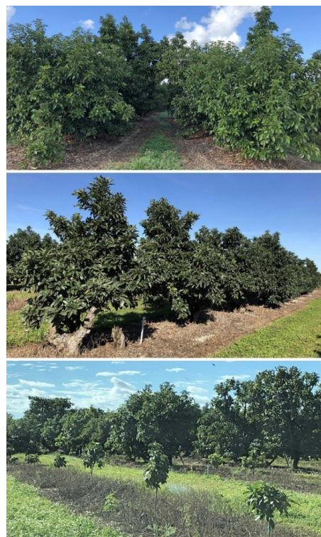
Figura 5. Exposición a la luz de áreas de arboledas muy sombreadas (A), injertadas con nuevas variedades (B) y recién sembradas (C).

muy densas y por lo tanto muy sombreadas (Figura 5; D. Carrillo y J. Crane, datos inéditos). Por lo tanto, se recomienda la implementación o restablecimiento de un programa de poda para mejorar la penetración de la luz solar dentro de las arboledas para reducir la actividad de los EA y nuevos brotes de ML. Alternativamente, el rejuvenecimiento o poda de injerto de los árboles adultos puede ser una opción para restablecer condiciones de alta iluminación dentro de las arboledas (descrita en detalle posteriormente).