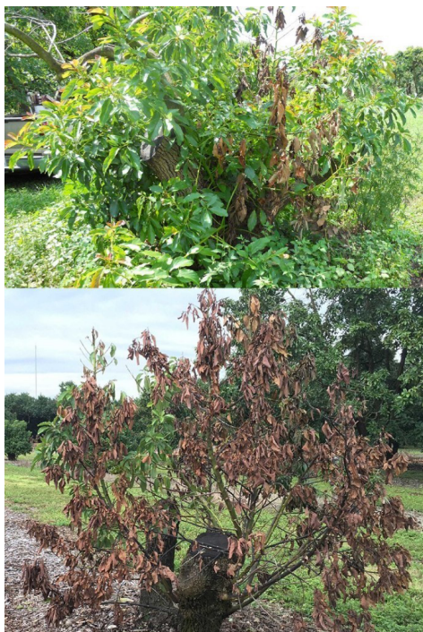
Figura 4. (A) Reverdecimiento y muerte regresiva en algunas ramas después de haber sido cortado a tocón (altura ~1.2 m), y (B) este nuevo crecimiento sufre muerte regresiva varias veces antes de que el árbol muere.

Por estas razones, los insecticidas convencionales sólo se recomiendan para suprimir las poblaciones activas de escarabajos ambrosia después de remover y convertir en serrín los árboles infestados, infectados o ambos.