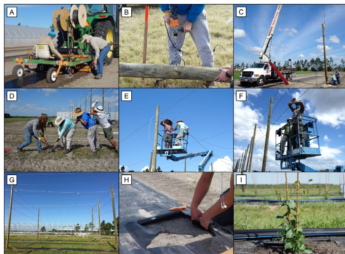
Figura 4. El proceso de establecimiento del campo de lúpulo en el UF/IFAS GCREC: A) instalación del cobertor de suelo y manguera de goteo, B) perforación de un agujero en un poste de 6", C) instalación del poste con una grúa, D) instalación de un cable de anclaje, E) instalación de cables de 5/16", F) instalación de cables de 3/16" para un tutorado en "V", G) bombillas LED instaladas en cables de 5/16", H) corte en el cobertor de suelo para el hoyo de plantación, y I) una plántula de lúpulo recién trasplantada. Créditos: Shinsuke Agehara y Aleyda Acosta-Rangel, UF/IFAS

El uso de iluminación suplementaria que asegura el buen crecimiento vegetativo antes de la floración es fundamental para una producción exitosa de lúpulo en Florida. En el campo de lúpulo de GCREC, instalamos bombillas LED (GreenPower LED flowering DR/ W, Philips) en los cables centrales del tutorado (Figura 5A). Nuestras recomendaciones actuales son espaciar las bombillas LED a 20 ft (6.1 m) de distancia en un patrón intercalado (138 bombillas por acre o 341 bombillas por hectárea) y operarlas durante 6 horas por noche (>17 horas de luz por día) durante 7 a 9 semanas o hasta que las plantas desarrollen suficiente crecimiento vegetativo. Las plantas normalmente comienzan a desarrollar botones florales 5 días después de apagar la iluminación suplementaria.