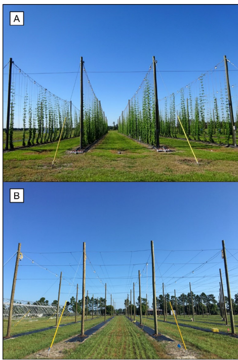
Figura 1. Campo de investigación de lúpulos de UF/IFAS GCREC: A) Tutorado recto, y B) Tutorado en "V".

las plantas de lúpulo cultivadas comercialmente son guiadas para crecer en un sistema de tutorado alto, generalmente de 12 a 18 ft (3.7 a 5.5 m) de altura (Dodds 2017). Los lúpulos comerciales se cosechan cortando los tallos en la base. Las coronas de las raíces permanecerán en el suelo, inactivas durante el invierno. Luego, a principios de la primavera se desarrollarán nuevos brotes.