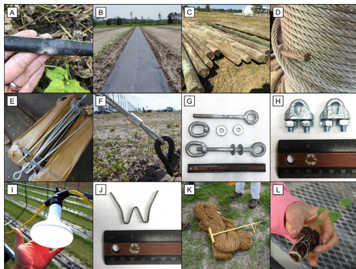
Figura 2. Materiales utilizados para el establecimiento de un campo de lúpulo: A) mangueras de goteo, B) cobertores de suelo, C) postes tratados a presión, D) cables galvanizados de 5/16" (tipo de filamento 7×19), E) anclajes, F) cable de anclaje asegurado con un casquillo de aluminio, G) armellas y tuercas, H) nudos para cables de metal de 3/16", I) bombilla LED instalada en un cable de 5/16", J) clip en forma de W para la instalación de cuerdas de tutorado, K) cuerdas de fibra de coco y un aplicador de clip en forma de W para la instalación de cuerdas de tutorado, y L) plántula de lúpulo propagada por cultivo de tejidos.

utilizados para construir el sistema de tutorado del campo de lúpulo.