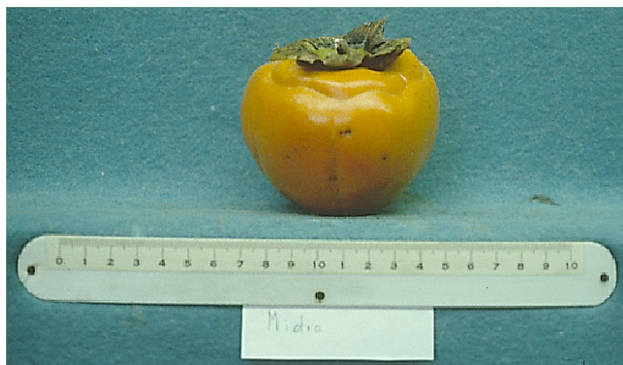
Figura 11. Cultivar 'Midia'.

con un anillo divisorio alrededor de la parte superior de la fruta. La temporada de cosecha es de finales de octubre a mediados de noviembre. 'Midia' no se recomienda para el norte o centro-norte de Florida.