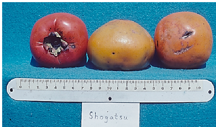
Figura 14. Cultivar 'Shogatsu'.