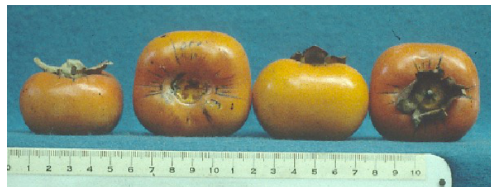
Figura 26. Cultivar ‘Great Wall’.

‘ Great Wall ’ es un cultivar de crecimiento vigoroso, de frutos pequeños con cuatro secciones (Figura 26). La pulpa es seca, similar a la de los frutos ‘Tanenashi’, pero de excelente calidad. El árbol crece verticalmente.