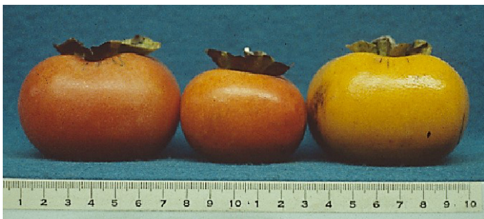
Figura 25. Cultivar ‘Hiratanenashi’.

‘ Hiratanenashi ’ es un cultivar comercial ampliamente producido en Japón (Figura 25). El fruto tiene una cáscara gruesa y una larga vida útil. La pulpa es jugosa, algo acuosa, y casi siempre no tiene semillas. La astringencia a veces es difícil de eliminar después de que el fruto ha sido cosechado, a menos que sean tratados artificialmente.