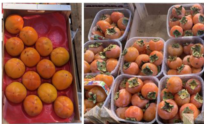
Figura 4. El tamaño y peso del fruto en el caqui puede variar de acuerdo al cultivar, desde 3,5 oz (100 g) a 14 oz (400 g).

El tamaño del fruto se ve afectado por la cantidad de fruto en la planta. Cuando menor la cantidad de frutos, mayor será el tamaño de estos. Frutos pequeños generalmente pesan entre 3.5 oz (100 g) a 4.5 oz (130 g), frutos medianos entre 5.5 oz (150 g) a 7.0 oz (200 g), y frutos grandes entre 8 oz (230 g) a 14 oz (400 g) (Figura 4).