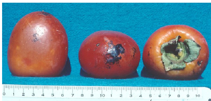
Figura 22. Cultivar 'Yomato Hyakume'.

'Yomato Hyakume' es un cultivar de polinización variante, pero no tiene una gran cantidad de pulpa oscura alrededor de las semillas. El fruto es grande, con un color rojo anaranjado profundo (Figura 22). A menudo, se produce un agrietamiento concéntrico del anillo. Este cultivar es un gran productor anual con buena retención de hojas en otoño. Es excelente para frutos secos y es uno de las mejores cultivares astringentes.