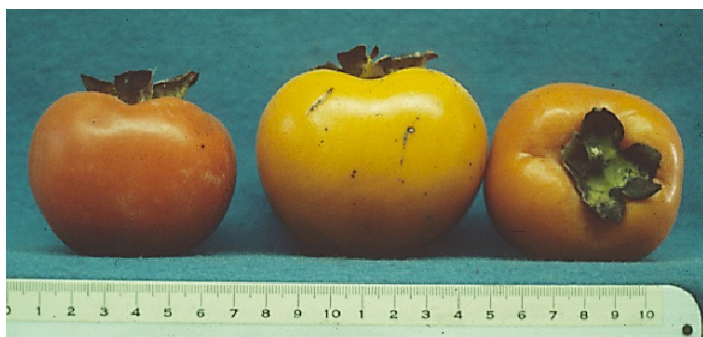
Figure 20. Cultivar 'Eureka'.

'Eureka' ha sido ampliamente propagado por los viveros del sur y es un cultivar común en Texas (Figura 20). Tienes frutos grandes, redondeados, achatados, de polinización variante, con una cantidad media de pulpa oscura alrededor de la semilla.