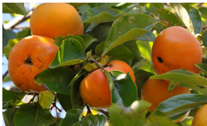
Figura 10. Cultivar ‘Maekawa Jiro’.

‘ Maekawa Jiro ’, un porte de yema ‘Jiro’, es de vigor bajo a moderado (Figura 10). El tamaño del fruto es grande, y su forma es oblata. Hay cierta tendencia a que la fruta sufra agrietamiento de la punta. La temporada de cosecha es de mediados de octubre a mediados de noviembre. ‘Maekawa Jiro’ no se recomienda para el norte y centro-norte de Florida.