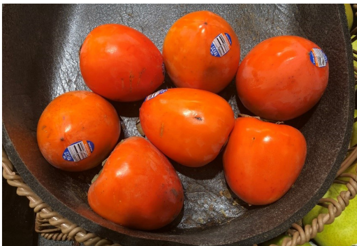
Figura 24. Cultivar ‘Hachiya’.