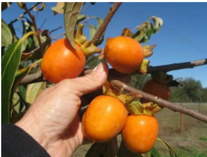
Figura 28. Cultivar 'Ormond'.