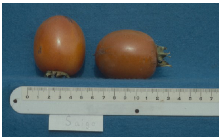
Figura 18. Cultivar 'Saijo'.