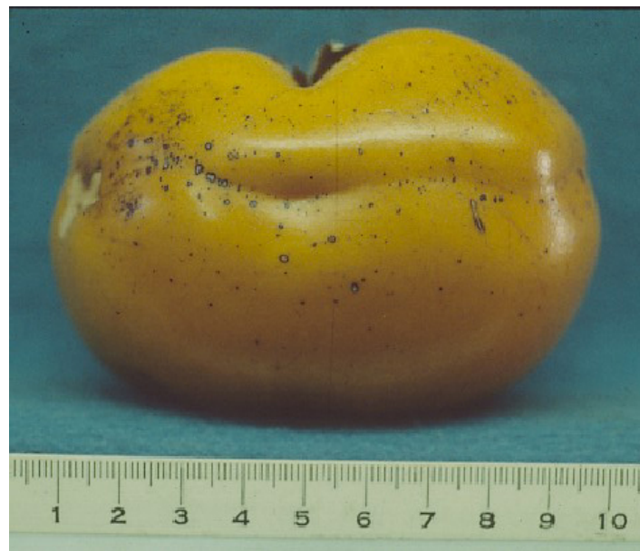
Figura 27. Cultivar ‘Tamopan’. Crédito de la fotografía:

‘ Tamopan ’ es un cultivar de fruto grande que tiene una depresión circular alrededor del tercio superior más cercano al tallo (Figura 27). La fruta es jugosa, acuosa y fibrosa, con una cáscara gruesa. Existe más de una variación de este cultivar, algunas de las cuales tienen mejor fruto que el descrito.