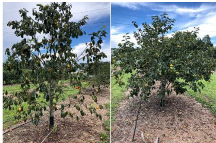
Figura 5. Tamaño y forma puede variar entre los cultivares ‘Saijo’ (izquierda) y ‘Fuyu’ (derecha).

tamaño del árbol se reduce entre el sur de Gainesville y el sur de Florida. Se ha observado que los árboles cultivados en Florida son a menudo más pequeños de lo que se esperaría en su lugar de origen; cultivares comunes apenas alcanzaron 10 pies de altura después de 10 años en ensayos durante la década de 1960.