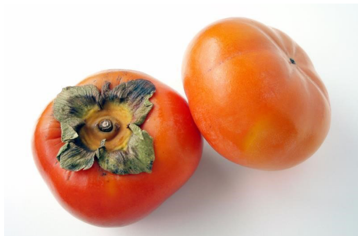
Figura 9. Cultivar ‘Jiro’.

‘ Jiro ’ es un árbol de vigor moderado. La producción de frutos puede ser errática cuando los árboles son jóvenes, pero el rendimiento es más consistente en árboles más viejos (Figura 9). El tamaño del fruto es de mediano a grande, los sólidos solubles oscilan entre 16%–19%, y la forma del fruto es oblata. La punta del fruto puede agrietarse. La temporada de cosecha es de mediados de octubre hasta mediados de noviembre. ‘Jiro’ es un cultivar recomendado.