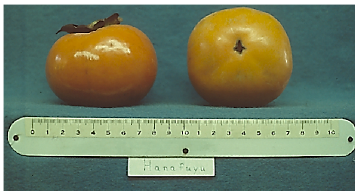
Figura 12. Cultivar 'Hana Fuyu'.

'Hana Fuyu', también conocido como 'Yotsundani' o 'Giant Fuyu', regula bien las cargas de fruto y es de vigor medio (Figura 12). El fruto es ligeramente más grande que la mayoría de caquis, generalmente están libres de imperfecciones, y pueden demorar en perder su astringencia. Este cultivar es bueno para los jardines caseros.