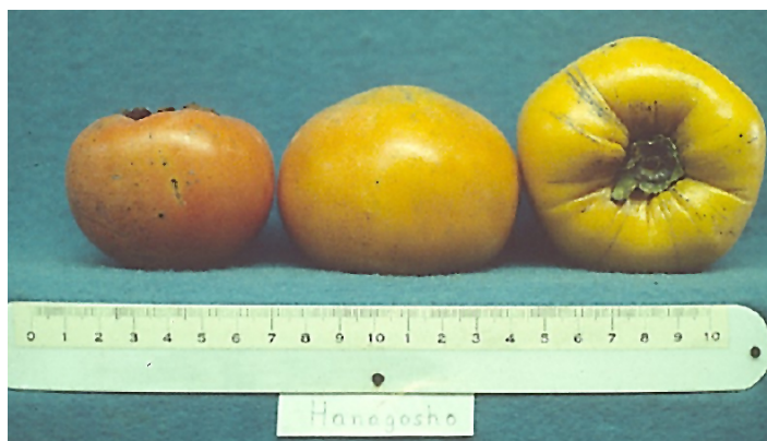
Figura 13. Cultivar 'Hanagoshō'.

'Shogatsu' es similar a 'Hanagoshō' en el hábito de crecimiento; sin embargo, tiene más problemas con rajaduras en el extremo de la fruta y manchas en las hojas (Figura 14).