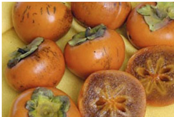
Figura 17. Cultivar 'Nishumura Wase'.

'Nishumura Wase' es un cultivar temprano, su primer fruto madura a principios de agosto (Figura 17). Es una variante de polinización y debe producir semillas para ser no astringente. Desarrolla flores masculinas constantemente. El fruto es algo acuoso y tiene alrededor del 13% al 15% en sólidos solubles. El árbol tiene buena distribución de la copa, es algo vigoroso y su rendimiento anual es bueno.