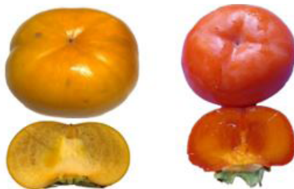
Figura 1. Caqui ‘Fuyu’ (izquierda) no astringente y caqui ‘Hiratanenashi’ astringente (derecha), cultivares listos para el consumo.

rayas oscuras en la pulpa independientemente de las semillas. En los cultivares astringentes de polinización variante, la pulpa oscura no es astringente incluso cuando está dura; por lo tanto, los cultivares astringentes que contienen semillas y son de polinización variante se comportan como frutos no astringentes. La cantidad de coloración oscura de la pulpa alrededor de las semillas varía de acuerdo con el cultivar. En la mayoría de las áreas del mundo, los frutos de tipo astringente y polinización variante, que tienen una gran cantidad de pulpa oscura, se clasifican como cultivares no astringentes. Sin embargo, típicamente en Florida, estos caquis se cultivan sin polinizadores, y su fruta astringente sin semillas requiere clasificarlos como frutos de tipo astringentes. Algunas manchas oscuras se pueden encontrar en la pulpa de ‘Fuyu’ y otros cultivares no astringentes. Esto no está vinculado a la producción de semillas y no tiene importancia para el sistema de clasificación variante-constante.