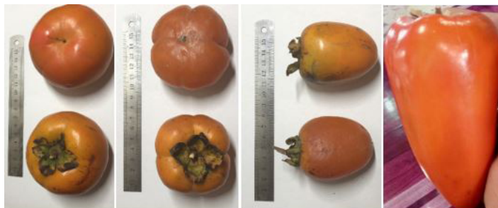
Figura 3. Diferentes formas de fruto de distintos cultivares de caqui.

en el ápice como una bellota), y oblatos (aplanadas como un tomate común) (Figura 3). Algunos cultivares tienen características notables, como un anillo con una división alrededor del fruto en los cultivares ‘Midia’ y ‘Tamopan’. Cuatro lados a veces son evidentes en el fruto de ‘Great Wall’ o ‘Saijo’. Secciones lobuladas diferentes están presentes en ‘Sheng’ y ‘Peiping’. Los frutos de algunos cultivares están metidos o plegados en el cáliz, como ‘Suruga’.