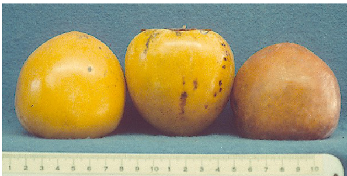
Figura 23. Cultivar ‘Tanenashi’.

a menudo sufrirá de agrietamiento de anillo concéntricos en el extremo apical y madurará de manera desigual a partir de estas zonas. En Japón, ‘Hachiya’ es mayormente utilizado para producir fruta seca. La astringencia del fruto permanece hasta que esté ha madurado completamente y se ablanda.