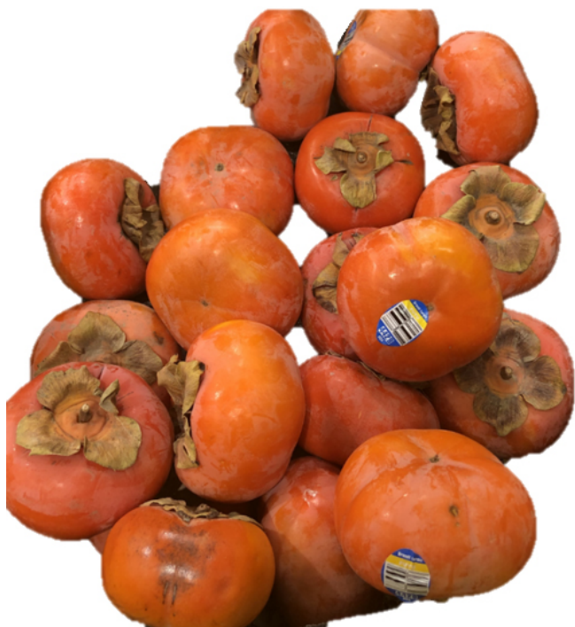
Figura 15. Cultivar 'Fuyu'.

de cosecha es de finales de noviembre a principios de diciembre. Parece ser susceptible a defoliación prematura. 'Suruga' no es recomendado para producción comercial.