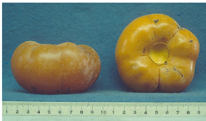
Figura 21. Cultivar 'Sheng'.

'Sheng' es un árbol de buena distribución de copa, que produce grandes frutos con secciones lobuladas que parecen tener forma de trébol de 4 ó 6 hojas cuando son vistos desde arriba (Figura 21). El fruto tiene un alto contenido de pulpa gelatinosa, son de color naranja brillante, y cuando es polinizado produce muchas semillas.