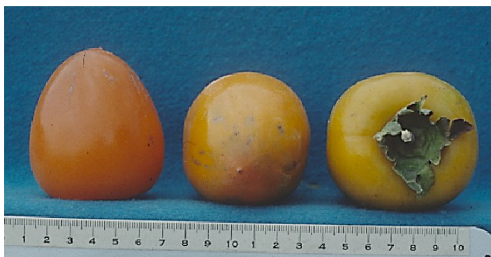
Figura 19. Cultivar 'Giombo'.