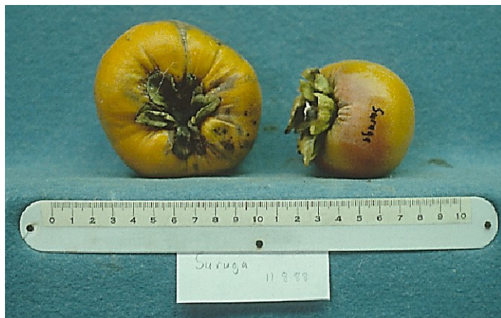
Figura 16. Cultivar 'Suruga'.