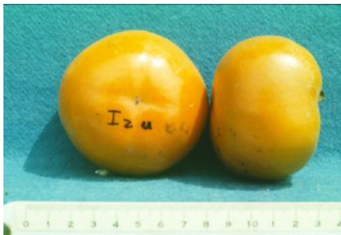
Figura 6. Cultivar ‘Izu’.

‘Izu’ tiene la distinción de ser el cultivar no astringente de maduración más temprana (Figura 6). El vigor del árbol es muy bajo y no es precoz. El tamaño del fruto es medio-grande, y los sólidos solubles promedian el 16%. La forma del fruto es oblata y un porcentaje considerable muestra imperfecciones. La temporada de cosecha comienza a finales de septiembre y termina a mediados de noviembre. A veces se recomienda ‘Izu’ debido a su maduración temprana.