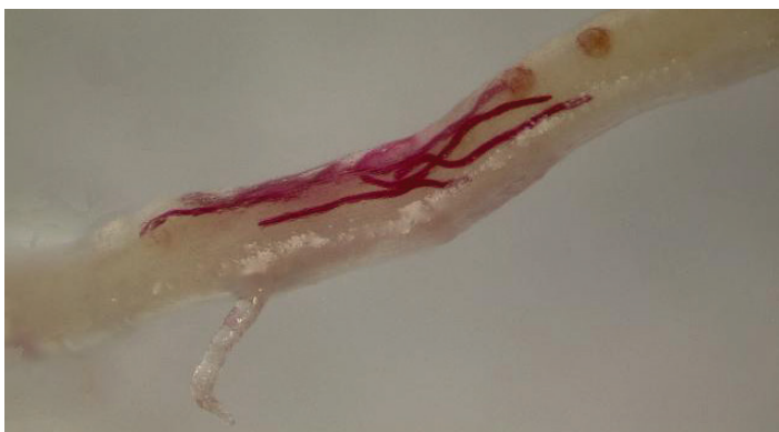
Figura 2. Los endoparásitos migratorios se alimentan con sus cuerpos metidos dentro de la raíz y se mueven de un sitio a otro en la raíz para alimentarse. Generalmente, todas las etapas de la vida tienen un tamaño relativamente similar.