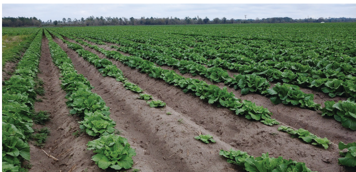
Figura 7. Repollo atrofiado y escasez de plantas al final de la temporada de crecimiento debido a la infestación por nematodos agalladores. Los síntomas son en parches con una distribución irregular basada en las poblaciones de nematodos y factores ambientales como la humedad del suelo.

Los síntomas de las raíces inducidos por los nematodos de aguijón o los nematodos agalladores suelen ser más específicos que los síntomas de la superficie. El nematodo de aguijón puede ser muy dañino, haciendo que las plantas infectadas formen un tejido apretado de raíces cortas que a menudo están hinchadas en las puntas (Figura 8). Las nuevas raíces a menudo mueren por infestaciones intensas del nematodo de aguijón, que se asemeja a la quemadura por fertilizante (Figura 9). Los síntomas de las raíces inducidos por los nematodos agalladores incluyen áreas hinchadas (agallas) en las raíces de las plantas infectadas (Figura 10). El tamaño de las agallas puede variar desde unas pocas hinchazones esféricas hasta áreas extensas de hinchazones tumorales alargadas, complejas, que resultan de la exposición de múltiples y repetidas infecciones debido a la abundancia de nematodos agalladores. Los síntomas de agallas de raíces o tubérculos pueden proporcionar una confirmación diagnóstica positiva de la presencia de nematodos agalladores, la gravedad de la infección y el potencial de daño a los cultivos en la mayoría de los casos.