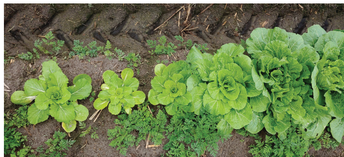
Figura 4. Enanismo y clorosis leve (coloración amarillenta) de las plantas de col al final de la temporada de crecimiento debido a la infestación por nematodos agalladores. Las plantas de la izquierda están más dañadas que las de la derecha debido a la variación de las poblaciones de nematodos y los factores ambientales.