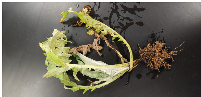
Figura 8. Síntomas del nematodo de aguijón en el sistema radicular de la alcachofa. Nótese el sistema radicular atrofiado, enredado y necrótico (marrón, tejido muriendo), así como la poda y la proliferación radicular lateral, que se ilustra con más detalle en la Figura 9. El brote también está severamente atrofiado.

Los síntomas de las raíces inducidos por los nematodos de aguijón o los nematodos agalladores suelen ser más específicos que los síntomas de la superficie. El nematodo de aguijón puede ser muy dañino, haciendo que las plantas infectadas formen un tejido apretado de raíces cortas que a menudo están hinchadas en las puntas (Figura 8). Las nuevas raíces a menudo mueren por infestaciones intensas del nematodo de aguijón, que se asemeja a la quemadura por fertilizante (Figura 9). Los síntomas de las raíces inducidos por los nematodos agalladores incluyen áreas hinchadas (agallas) en las raíces de las plantas infectadas (Figura 10). El tamaño de las agallas puede variar desde unas pocas hinchazones esféricas hasta áreas extensas de hinchazones tumorales alargadas, complejas, que resultan de la exposición de múltiples y repetidas infecciones debido a la abundancia de nematodos agalladores. Los síntomas de agallas de raíces o tubérculos pueden proporcionar una confirmación diagnóstica positiva de la presencia de nematodos agalladores, la gravedad de la infección y el potencial de daño a los cultivos en la mayoría de los casos.