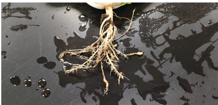
Figura 10. Agallamiento severo (hinchazones de forma irregular) de las raíces del repollo debido a la infestación por nematodos agalladores.

El momento y la gravedad de los síntomas de daño por nematodos están relacionados con la densidad de población de nematodos, las especies de nematodos fitoparásitos presentes, la susceptibilidad de los cultivos y las condiciones ambientales predominantes. El nematodo aguijón es muy dañino incluso en escasa abundancia, y los síntomas generalmente aparecen al principio de la temporada. En contraste, los cultivos de coles tienen una tolerancia algo mayor a los nematodos agalladores y los síntomas tienden a aparecer más tarde en el año. Cuanto más severa es la presión de los nematodos (mayor es la abundancia), más tempranos y severos son los síntomas. En niveles de infestación menos graves, la expresión de los síntomas puede retrasarse hasta más tarde en la temporada de cultivo, después de que se hayan completado varios ciclos reproductivos de nematodos en el cultivo. En este caso, los síntomas en la superficie no siempre serán evidentes en las primeras etapas del desarrollo del cultivo, pero con el tiempo y la reducción del tamaño y función del sistema radicular, los síntomas pueden volverse más pronunciados y más fácil de diagnosticar. En algunos casos, los síntomas del daño pueden ser demasiado sutiles para detectarlos, incluso si está ocurriendo pérdida de rendimiento.