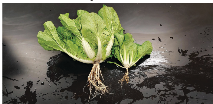
Figura 11. La infestación severa de nematodos agalladores deteriora la función de la raíz y conduce a un crecimiento reducido (planta de la derecha) en comparación con la planta sana (planta de la izquierda). La planta infestada tiene un sistema radicular atrofiado con menos raíces laterales y agallas severas (hinchazón de forma irregular de la raíz).

en particular varían según el cultivo (se dice que un cultivo en el que un nematodo puede reproducirse y causar daño es susceptible a ese nematodo; un cultivo capaz de mantener el rendimiento a pesar de la infección y reproducción del nematodo es tolerante a ese nematodo). Un resumen de la susceptibilidad de cultivos de coles comunes en Florida a nematodos parásitos de plantas se provee en el Cuadro 1, pero no todas las combinaciones han sido probadas. Además, para la mayoría de las combinaciones de cultivos de coles y nematodos, las funciones de daño (pérdida de rendimiento esperada a varios niveles de población de nematodos) para un nematodo dado no se han determinado con precisión. Los cultivos de temporada más larga que se cultivan en meses más cálidos tienden a tener mayor riesgo de daño por nematodos porque estas condiciones favorecen el aumento de poblaciones de nematodos.