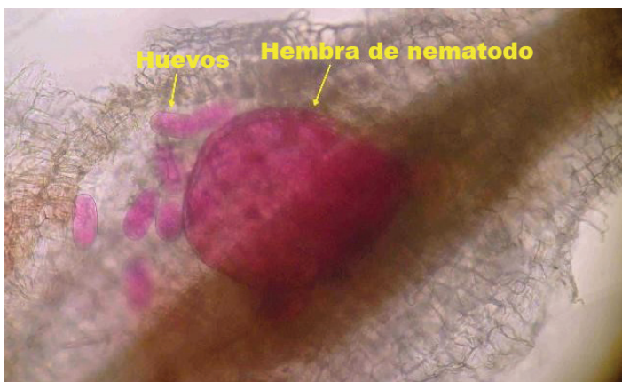
Figura 3. Los endoparásitos sedentarios (el nematodo agallador se muestra aquí) establecen un sitio de alimentación complejo en la raíz al ser una hembra joven o inmadura y no se mueven de ese sitio por el resto de sus vidas. Las hembras adultas aumentan de tamaño a medida que se alimentan y producen huevos.