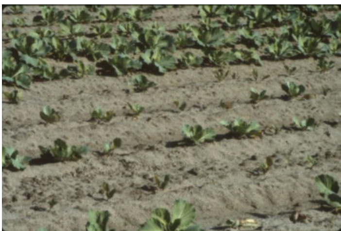
Figura 6. Enanismo del repollo inducido por nematodos de aguijón y establecimiento deficiente.