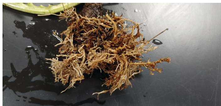
Figura 9. Vista de cerca del daño del nematodo de aguijón en raíces de alcachofa. Las raíces laterales son cortas con puntas de las raíces que están hinchadas y parecen quemadas debido a una necrosis severa (marrón, tejido muriendo). También tenga en cuenta la necrosis general del sistema radicular.