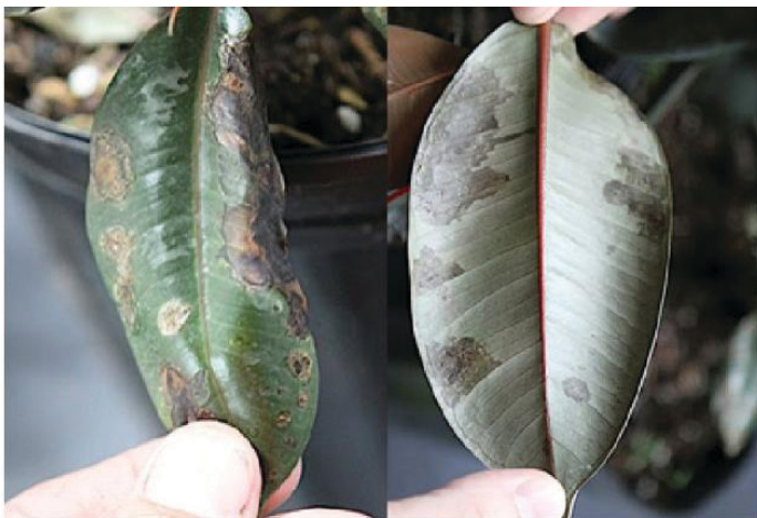
Figura 3. Síntomas clásicos de ambos lados de una hoja madura de Ficus .