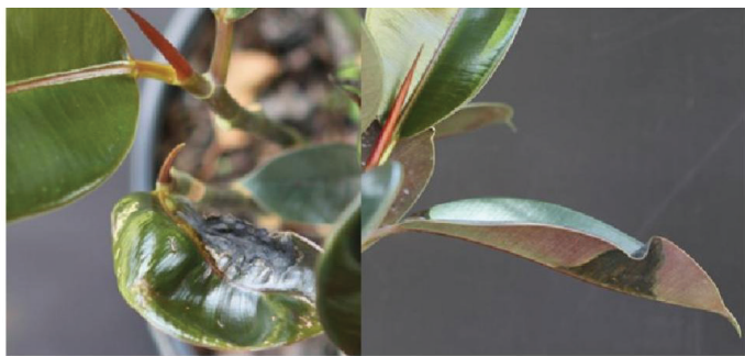
Figura 2. Mancha foliar en Ficus elastica , "Burgundy" causadas por Xanthomonas .

lesiones se agrandan y pueden cubrir grandes porciones del área foliar. Eventualmente, las lesiones se vuelven marrones con bordes de color amarillo- verdoso, causando la muerte prematura y caída de las hojas (Figuras 4 y 5)