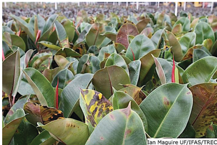
Figura 5. Alta incidencia y severidad de la plaga causada por la bacteria Xanthomonas en F. elastica .