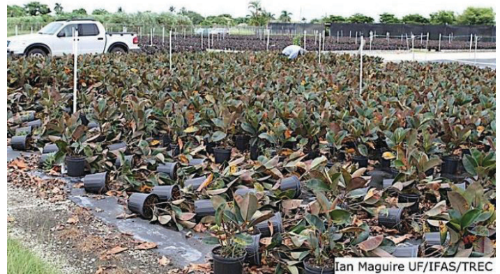
Figura 1. Enormes pérdidas económicas causadas por la bacteria Xanthomonas en viveros que cultivan Ficus elastica (Julio del 2010).

Desde sus comienzos hasta la actualidad, esta enfermedad ha causado pérdidas de cosechas enteras en diversos viveros. ( Ficus elastica Campoverde y Palmateer, 2011) (Figura 1).