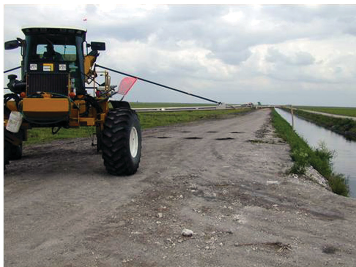
Figura 5. Reduzca la velocidad al doblar para evitar la aplicación errada a los caminos, canales, y zanjas.