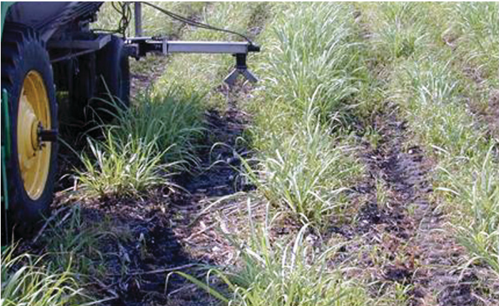
Figura 1. La aplicación de fertilizante fosfóricos en banda aumenta la eficacia de el uso de P por el cultivo.