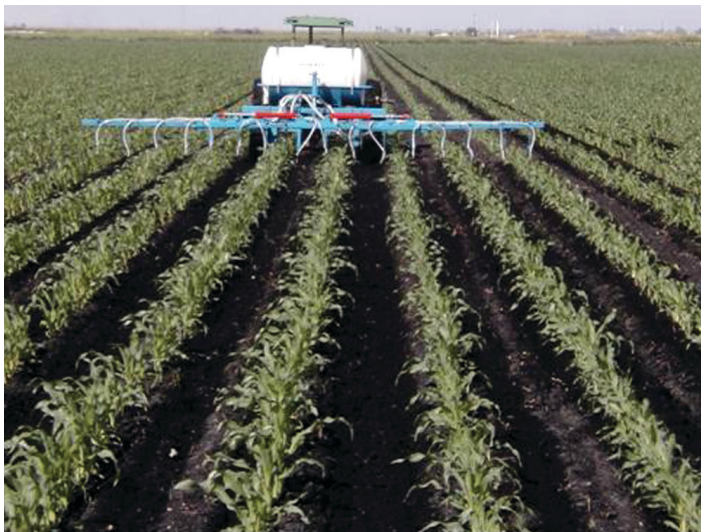
Figura 3. La aplicación en banda reduce las tasas de fertilización y la probabilidad de re-aplicación en el mismo surco.

viable para reducir la cantidad de P usada en la producción de maíz dulce en los suelos orgánicos (Sánchez et al. 1991), puesto que proporciona un método para obtener una producción rentable de maíz dulce a la vez que reduce al mínimo los riesgos ambientales.