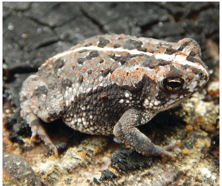
Figura 5. Los sapos de roble nativo son pequeños y tienen glándulas pequeñas y ovales en sus hombros. Las crestas emparejadas en la parte superior de sus cabezas son indistintas.