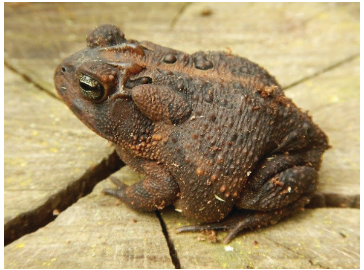
Figura 4. Los sapos del sur nativos tienen glándulas pequeñas y ovales en sus hombros y un par de crestas o crestas elevadas en la parte superior de sus cabezas.