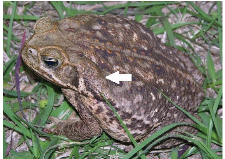
Figura 2. Los sapos invasores de caña tienen glándulas venenosas muy grandes en sus hombros (indicadas con una flecha); estas glándulas son algo triangulares, disminuyendo gradualmente hasta formar una punta. También tienen una cresta alrededor de los ojos y sobre la nariz.