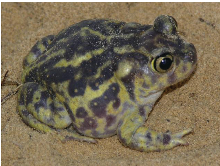
Figura 6. Los sapos orientales de pie de palas nativos del este de Florida generalmente tienen menos de 2 pulgadas de largo y pueden tener numerosas marcas amarillas.

Vea el video para obtener más información sobre cómo identificar con precisión los sapos en La Florida: https://www.youtube.com/watch?v=RMzLes3BaCo&t=529s .