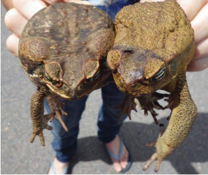
Figura 3. Sapo de caña hembra a la izquierda y macho a la derecha. Observe las diferencias en el color y la textura de la piel.

o nueve pulgadas. Los machos y las hembras se pueden distinguir por las diferencias en la coloración y la textura de la piel de la espalda; las hembras tienen la espalda lisa, moteada, marrón y blanca, mientras que la espalda rugosa de los machos es más amarilla (Figura 3). Los sapos de caña bebé recientemente transformados de renacuajos son del tamaño de las pasas y se confunden fácilmente con los sapos nativos.